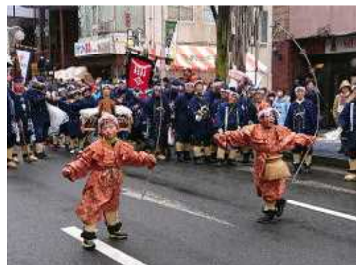
<石堂えんぶり組で活躍する子どもたち>